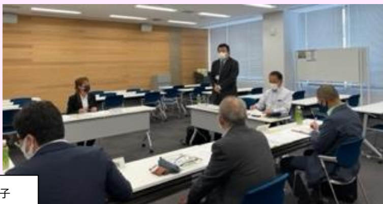
登録審査委員会の様子