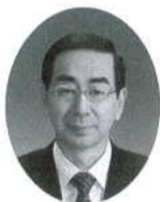
第38回北信越国民体育大会 会長 公益財団法人福井県体育協会 会長 福井県知事 西川 一 誠

第38回北信越国民体育大会が北信越各県から選手・監督並びに役員の皆様をお迎えし、福井県において盛大に開催されますことは、この上ない喜びであり、県民を代表して心から歓迎申し上げます。