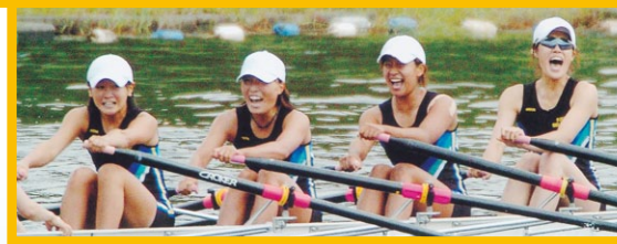
【ボート：成年女子】 舵手付きクオドルプル 優勝 福井 選抜