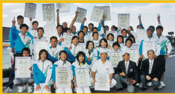
【ボート競技】 競技別天皇杯獲得 福井県