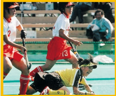
【ホッケー：少年少女】 準優勝 丹生 高校 チーム 決勝：体勢を崩しながらもシュートを放つ、丹生イレブン