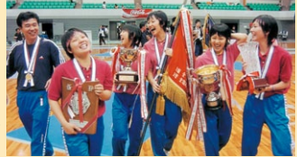
フェンシング：女子団体 優勝 武生商業高校チーム