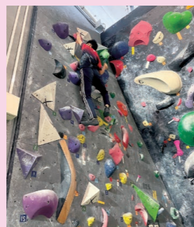
スポーツクライミング

競技団体の活動拠点で県内トップ選手を指導する指導者から競技の楽しさや魅力を学びます。5年生のクロストレーニングで興味をもった競技を選択します。