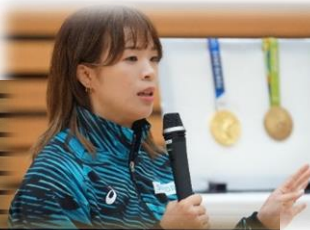
レスリング競技:金城 梨紗子 氏 (リオ五輪・東京五輪 フリースタイル 金メダル)